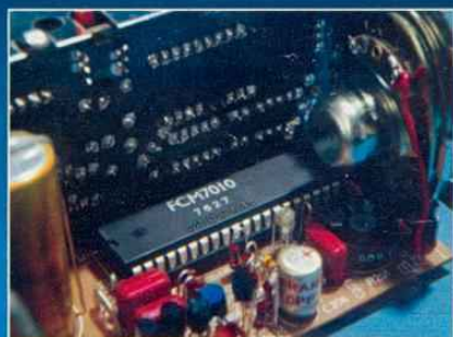
Uhrenmodul in IC-Technik